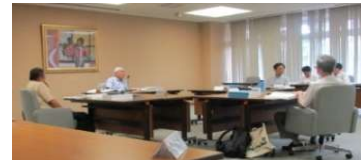
環境影響評価技術委員会（水象部会）

環境保全への適正な配慮の推進のため、リニア中央新幹線に係る環境調査並びにトンネル工事及び発生土置き場における環境保全等について、県環境影響評価技術委員会、関係市町村、地元住民等の意見をもとに、環境保全のための助言を通知する。