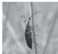
フサヒゲルリカミキリ