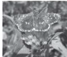
チャマダラセセリ