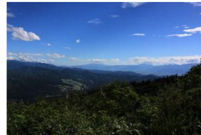
ひじりやま 聖山 山頂展望