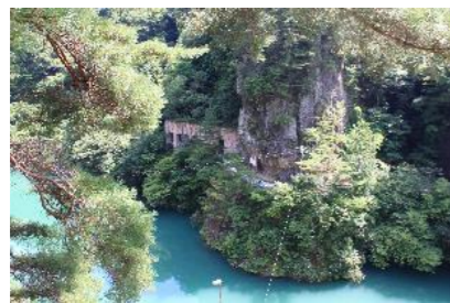
さんせいじ 山清路

【参考文献】「信濃の東山道」(長野県文化財保護協会 2005年3月) 「信越古道」(信越古道交流会 2007年12月)