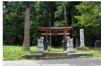
ひじり だいじんじゃ 樋知大神社