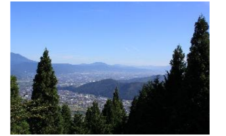
かむりきやま 冠着山からの展望