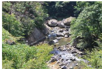
さしきりきょう 差切峡