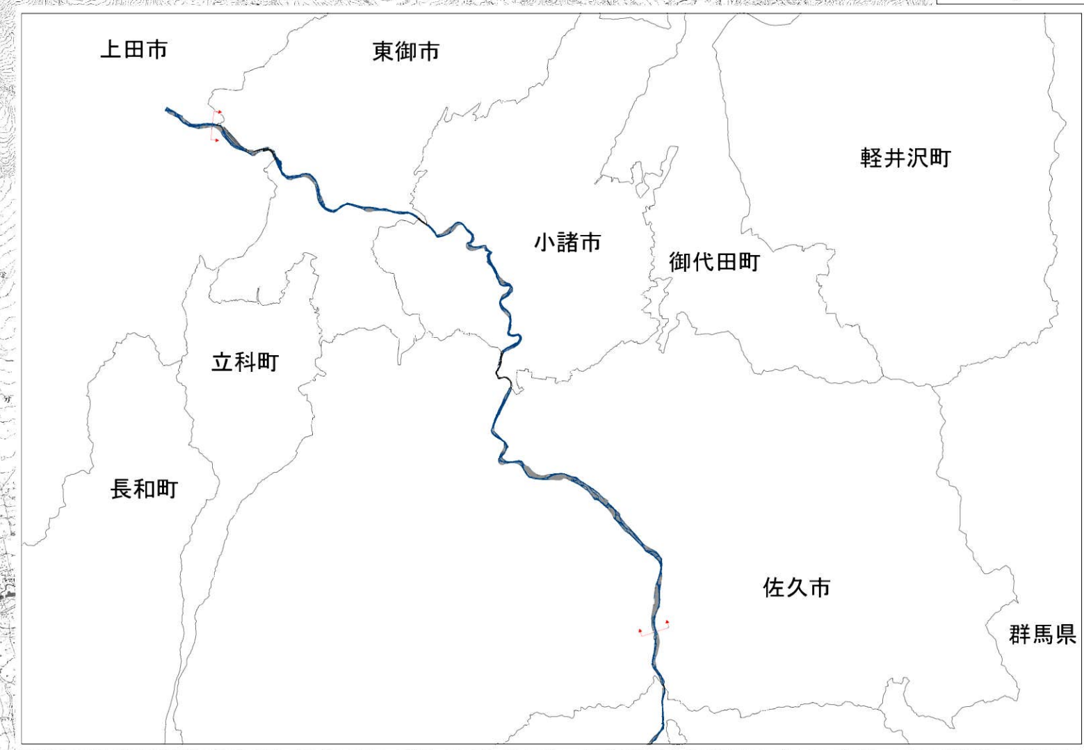
信濃川水系千曲川 洪水浸水想定区域図 浸水継続時間（想定最大規模降雨）