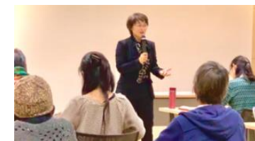
【KISO女性わか者起業塾】

さらに、飯山市の「いいやま女性起業塾」、県北信地域振興局「地域おこし協力隊起業塾」、県木曾地域振興局による女性・若者を対象とした「KISO女性わか者起業塾」の実施を支援し（チーフ・キュレーターによる講義）、女性や若者、地域おこし協力隊による社会的起業を促進した。