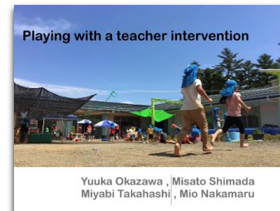
[学生が作成した英語版日本の保育紹介ビデオタイトル]

10月には、入学後初めての本格的な実習である2週間の幼稚園教育実習が行われ、実践での保育者の仕事に触れ、子どもや保育理解を深める学びとなった。