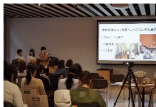
[成果報告会の様子]

年度末には成果報告会を開催した。1年次の学生や教職員も参加し、実習で学んだ成果などを発表した。聴講した教職員からは励ましのコメントなどが寄せられた。