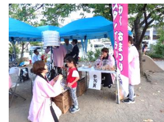
〔第三地区子どもフェスタ〕

実施にあたっては、機会を捉えて寮生に対し活動を促すだけでなく、特定非営利活動法人長野県NPOセンターに、学修プログラムの提供及び提供先と学生とのマッチング業務を委託し、円滑な実施に努めた。学生からの活動報告書や受入れ団体へのアンケートから、高い満足度が得られた。なお、2019年度の取組状況は、寮生242人のうち177人（73.1%）が参加し、113人の学生から活動の報告があった。