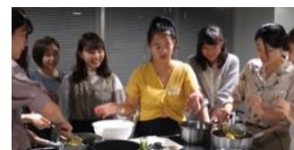
[海外研修員と学生の交流]

地域に開かれた大学として、2018年度に引き続き、「信州ソーシャル・イノベーション塾」、「専門職向け起業塾」、「コラボ公開講座」を開催した。また、新たな取組として、先進的な取組を行う経営者をゲストに迎え「経営者トークライブ」を開催したほか、旧出前講座をリニューアルした「デリバリー・アカデミア」の運用を開始した。さらに、県からの依頼によりCSIが受け入れたブラジルからの海外技術研修員と学生が、講義やイベント（エシカルクッキング等）を通じて交流し、互いの文化を知る貴重な機会となった。