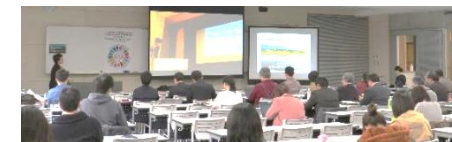
【農水省シンポジウムサテライト中継】

また、国と連携した新たな取組として、チーフ・キュレーターが農林水産省の「持続可能な生産消費形態のあり方検討会」の座長を務め、同省主催により2月に開催された「SDGs×生物多様性シンポジウム」においては、全国初となる同省のサテライト中継を本学において実施した。