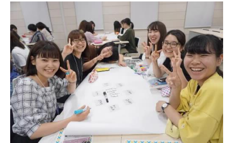
[象山未来塾の様子]

多方面のプロフェッショナルをゲストに迎え、寮生とのディスカッションやグループワーク等を実施した。様々なイノベーションの思想に触れることで、寮生が自分のキャリアについて向き合う機会となった。寮生の満足度も高く昨年度と比べ参加者が50人以上増え、高い学習効果を得ることができた。