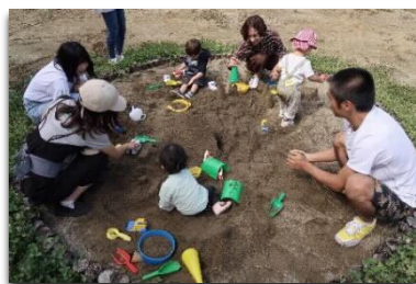
[親子のひろばの様子]

加えて、本企画のリーダーとなっている学生5人が、長野県内・北海道・千葉県・福岡県の保育及び地域子育て支援関係施設の視察を行い、先進的取組について学び、広場運営に生かした。