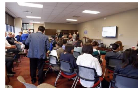
[ビジネス研修の様子]

修(英語)とビジネス研修を実施した。語学研修は、「ビジネス」をテーマとし、2年次1学期までに英語集中プログラムを通じて習得した英語力のうち、特に発信する力(会話やプレゼン能力)を重点的に伸ばす内容で行った。ビジネス研修は、講義、ワークショップ、企業訪問、調査研究などの活動を研修先に応じて組み合わせながら実施した。企業訪問は、研修先の国や地域ならではの産業に関連する企業、団体等で行った。前後に講義やワークショップ形式の事前準備や振り返りを行うことを基本とし、訪問先ごとにまとめのプレゼンテーション等を現地で行った。