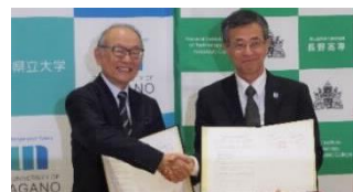
【包括連携協定 (長野高専)】

1月31日に長野工業高等専門学校と包括連携協定を締結した。本学として教育機関との初の連携協定である。専門が異なる両者の連携により、教員・学生の相互交流を通じて新たな知の創造や人材育成の向上が今後期待される。また、県内高校の人材育成に資するため、飯山高校探究科授業や小諸商業高校「高校生向け起業家教育事業」(中小企業庁事業)、木曾青峰高校「未来の学校構築事業」(県教育委員会事業)等の実施をC S I教職員が支援した。