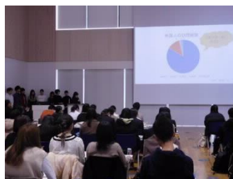
[合同発表会の様子]

2019年度は、15クラス(1クラス16人程度)で授業を行った。2月に実施した合同発表会では、13のテーマの成果発表がなされ、学外からは高校生を含め90人余りの参加者があった。また、学生の”学び”への意欲向上の動機付けのため、学長賞及びオーディエンス賞を設け評価を試みた。学生は多くの聴衆の前で発表し評価されることで、各自を振り返り今後の学修につなげた。