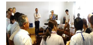
【信州環境カレッジ×長野県立大学C S I協働講座】

「信州ソーシャル・イノベーションフォーラム2019」の運営補助 (20人参加)、「長野県版エンカルマップ」作成のためのエンカル事業者訪問・取材 (10人)、「信州環境カレッジ×長野県立大学C S I協働講座」参加 (3人)、「日本青年会議所主催第50回 長野ブロック大会」へのパネリスト参加 (1人)、中野市主催「わくわく信州なかの100人会議」参加 (3人) など。