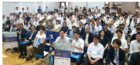
【信州ソーシャル・イノベーションフォーラム 2019】

県内の行政機関職員（県・市町村）と全国の気鋭の社会起業家とのマッチングを図る県内初の試みとして、長野県及び長野市と共催で、かつ、日本ユニシス㈱の特別協賛を得て、7月30日に本学三輪キャンパスにて開催し、184人の参加者を得た。全国で地域課題解決に向けた先進的な取組を行う社会起業家等12人（11社）をゲストに招き、行政機関職員に取組を紹介するなど両者のマッチングを図る県内でも初の取組であり、行政機関が民間事業者と連携して行う革新的な課題解決方法を学ぶ機会となった。今後、具体的な行政施策への反映が期待される。