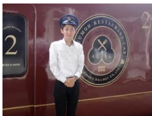
[インターンシップの様子]

5月1日にインターンシップガイダンスを開催し、200人以上の学生が参加した。その後のマッチングを経て、最終的には74人がキャリアセンターを経由した実習に参加した。実習前には4回の事前研修を行い実習の意義やビジネスマナーを学生にレクチャーした。実習中は受入先を訪問し、学生の様子を確認したほか、企業との関係構築に努めた。