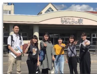
[北海道の施設視察の様子]