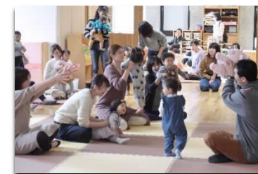
[新米ママ&パパのための 子育て講座の様子]

また、子育て中の親子に関する情報共有や関係機関の連携を目的として、長野市や周辺地域の地域子育て支援の実務担当者を対象とした協議会を開催した。行政関係者のほか、子育て支援センター職員、保育関係者、助産師など、地域で子育て支援、虐待対応などに取り組む多様な関係者との連携を図った（計2回、延べ28人参加）。