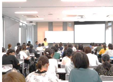
[健康発達実習報告会]

健康発達学部の学部共通科目、「健康発達実習」（1年次必修科目）は、長野市内の認定こども園、保育所、小学校、高齢者福祉施設等の協力を得て行う授業である。発達段階に応じた健康増進についての調査研究、並びに、長野市大岡地区での農業体験、地域の食文化や生活文化との交流を通じ学びを深めている。これら実践の場での体験は、実習先関係者を招いての報告会、調査先へのフィードバック等、振り返りとともに、次の課題発見につながる学びとなっている。