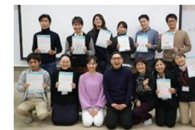
[信州ソーシャル・ イノベーション塾]