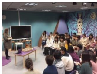
[フィンランドでの研修の様子]