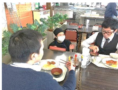
[食堂での食事指導の様子]

県長野保健福祉事務所との連携で、2年次の学生3人とともに、2月28日、県庁食堂ししとうで「働き盛りの健康づくり」事業を実施した。長野県民の健康づくり支援のための食環境整備の一環として、食堂利用者を対象に、食塩の過剰摂取と野菜摂取量の減少という食生活の課題解決を目的とした適切な食事並びに情報の提供を行った。その結果、経過評価からは利用者並びに食堂スタッフから、正しい情報収集と行動変容の動機付けになったとの評価を得た。さらに、県長野保健福祉事務所との振り返り会議においても、今後、県民の健康づくり支援として更なる食環境整備に継続活用することとなった。