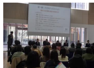
[業界研究会の様子]

2月には、県内の優良企業・団体の人事担当者による業界研究会を開催した。パネルディスカッションとブースに分かれての説明会を行い、100人の学生が企業・団体の求める人材像等を担当者から直接聞くことができ、高い満足度が得られた。