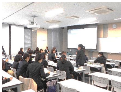
[臨地実習後の報告会の様子]

このような管理栄養士の実践現場での学び、専門性を活かした進路を考える土台として、1年次必修科目である「管理栄養士活動論」が開講されている。行政、医療施設、企業、教育分野、福祉施設など、第一線で活躍する管理栄養士をゲストスピーカーとして招き、学生との双方向のディスカッションも含めた講義により、臨地実習先での活動のイメージを共有できるようなカリキュラムの組み立てとなっている。