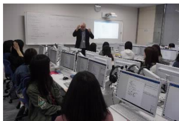
[CALL教室での授業の様子]

1年次と2年次の必修科目として英語集中プログラムを実施した。CALLシステム（コンピュータを活用した外国語学習）も利用しながら、正確な英語運用能力を高める科目と英語コミュニケーション能力を高める科目の両方を履修することにより、バランスよく実践的な英語力を養成し、また、「読む・聞く・書く・話す」の4技能融合型の授業によって、4技能を有機的に使いこなす力を身に付けている。