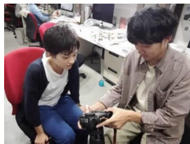
[インターンシップの様子]

平成30年度については、学生がまちなみカントリープレス (出版社) のインターンシップに参加し、主体的に就業体験を積む機会を持った。