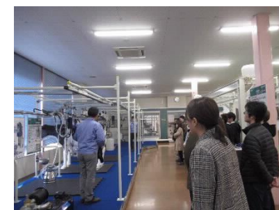
[GM学科による企業訪問の様子]

県内企業等との連携を通じて学生の学修機会を充実させることにより、プログラム後の学修成果の共有や、本学の産学連携促進に寄与することが期待できる。