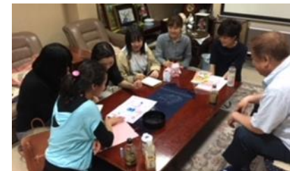
[三輪地区商店街夏祭りポスター作成]

平成30年度の取組状況は、寮生242人のうち141人 (58.3%) が参加し、123人の学生から活動の報告があった。