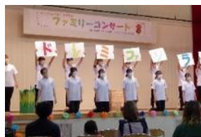
[飯綱町ファミリー コンサートの様子]

さらに保育士、子育て支援センター職員の保育・子育て支援に関する2回の合同研修会に本学教員2名がアドバイザーとして参加したほか、オンデマンド研修教材1点を作成・提供した。