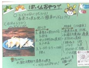
[アレルギーに配慮したおやつレシピ]

令和5年度においては、食物アレルギーをもつ子どもに配慮したお菓子のレシピを検討し、おやつ教室を実施する事業や、心の孤立のリスクがある子どもと大人をマッチングするバディプログラムを実施する事業、学内で自ら関心がある取組について学生同士が相談できる場や情報の提供、学生同士のつながりを提供する事業、子どもを対象に自らの関心事を表現できるよう哲学対話やアートワークによるアプローチを行う事業を採択した。