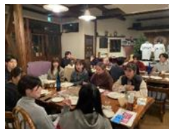
[高山村活性化プロジェクト]