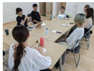
[バディプログラムキックオフミーティング]