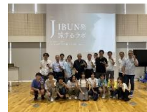
[JIBUN 発 旅するラボ]

また、屋代高校・付属中学校探究活動、飯山高校探究科授業の実施をCSI教職員が支援した。