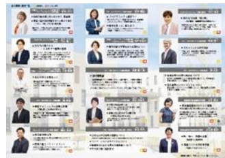
[デリバリー・アカデミア]