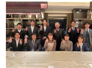
[象山未来塾の様子]