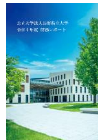
[令和4年度財務レポート]

県民、企業、自治体、設立団体等多様なステークホルダーに対し、設立団体である長野県からの運営費交付金や、在学生からの学生納付金等を財源としながら、どのような事業や取組を大学が実施し、成果に繋げているかを報告するため令和4年度財務諸表をもとに「令和4年度財務レポート」を作成した。