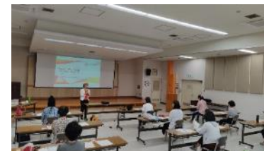
[KISO女性・若者起業塾]

県北信地域振興局「地域おこし協力隊起業塾」、県木曾地域振興局による女性・若者を対象とした「KISO女性・若者起業塾」の実施を支援し(センター長による講義)、女性や若者、地域おこし協力隊による社会的起業を促進した。