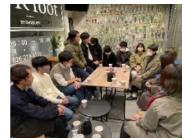
[ついたち会の様子]