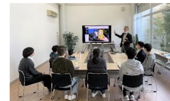
[JIBUN 発 旅するラボ]

県教委とKDDI(株)との包括連携協定に基づく連携事業として、長野県中小起業家同友会の協力のもと令和3年度に引き続き、「JIBUN 発旅するラボ」を実施し、高校生がさまざまな人から生き方を学び地域を深く知ることを通じて自分の立てた問いに向き合う探究の場づくりを行った。(高校生17人、本学学生8人参加、オンラインイベント3回、対面イベント5回等)