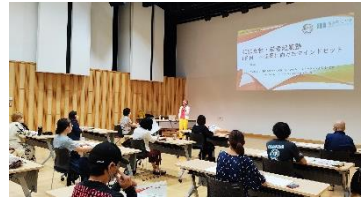
[KISO 女性・若者起業塾]

このほか、県北信地域振興局「地域おこし協力隊起業塾」、県木曾地域振興局による女性・若者を対象とした「KISO女性・若者起業塾」の実施を支援し（チーフ・キュレーターによる講義）、女性や若者、地域おこし協力隊による社会的起業を促進した。