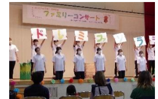
[飯綱町ファミリーコンサートの様子]

さらに毎月、保育士、子育て支援センター職員の保育・子育てに関する合同研修会に本学教員2名がアドバイザーとして参加した。