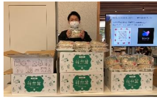
[SDGs 配慮商品の認知度向上プロジェクト]