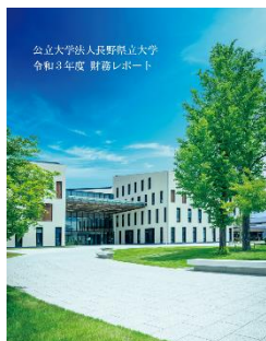
[令和3年度財務レポート]

県民、企業、自治体、設立団体等多様なステークホルダーに対し、設立団体である長野県からの運営費交付金や、在学生からの学生納付金等を財源としながら、どのような事業や取組を大学が実施し、成果に繋げているかを報告するため令和3年度財務諸表をもとに「令和3年度財務レポート」を作成した。