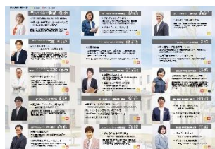
[デリバリー・アカデミア]