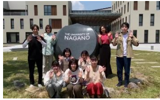
[王滝村押し村プロジェクト]