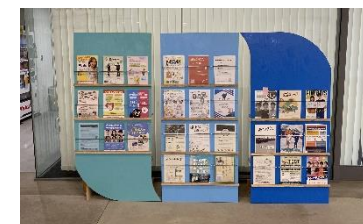
[県産木材を使用して作成したパンフレットラック]