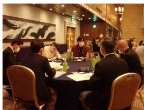
[象山未来塾の様子]