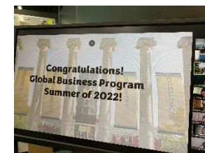
[オンラインプログラムの様子]

グローバルマネジメント学部においては令和2年度入学者（3年次）を対象に、オンラインを主とした手段とする代替プログラムを実施した。実施に際しては、令和3年度の改善点を補いながらプログラムの設計を行い、オンラインであっても海外現地での研修と同等の学びを得られるよう設計された代替プログラムを実施した。各プログラム終了後にはアンケートを実施し、概ね8割以上の学生が研修内容に満足しているという結果を得た。