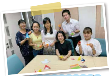
インターンシップ生が 日本文化を伝える折り紙教室を 開催しました!!