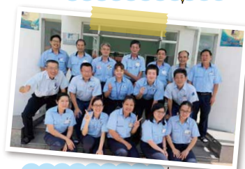
ベトナムのインターンシップ 受け入れ先企業の皆さん