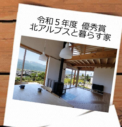
令和5年度 優秀賞 北アルプスと暮らす家