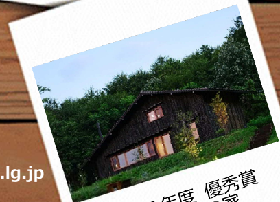
令和5年度 優秀賞 信州焼杉の家