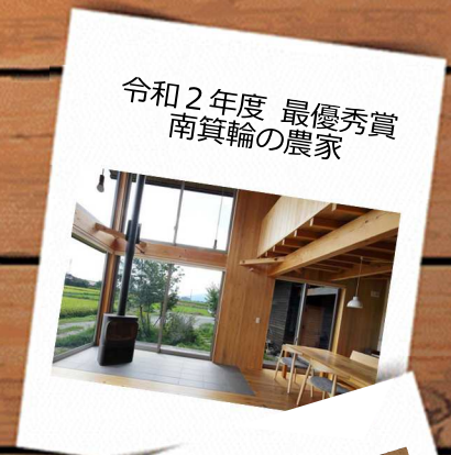
令和2年度 最優秀賞 南箕輪の農家