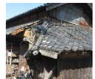
緊急代執行を要する 崩落しかけた屋根