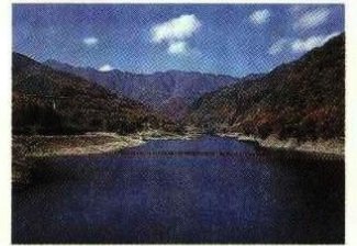
周囲の山々をうつす内村ダム(鹿鳴湖)