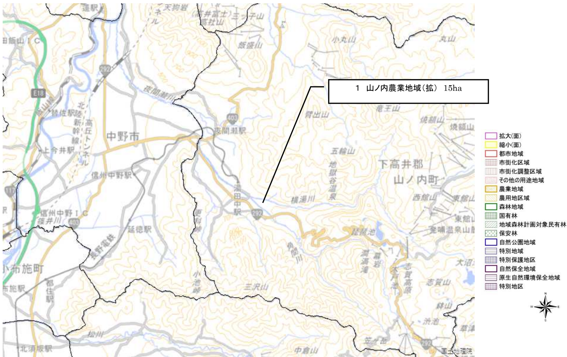
図の中心位置： 36.740, 138.420（北緯,東経） 縮尺 1:96000