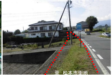
一般県道 土合松本線