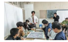
▲高校生の探究活動と連携した取組