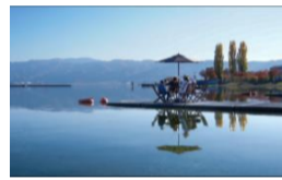
▲市町村のプロジェクト支援