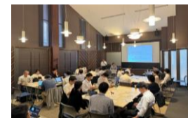
▲市町村や民間事業者を交えた検討会の実施