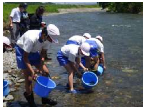
過去に実施した放流の様子