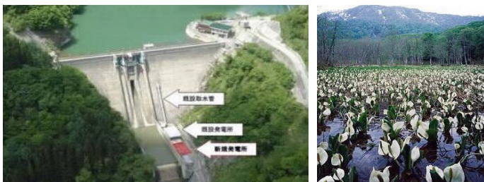
水芭蕉発電所（長野市） （出力999kW 約1,400世帯分を発電）