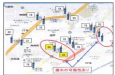
ソフトによる解析 (表示例)