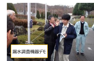
漏水調査機器デモ