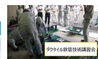
ダクタイル鉄管技術講習会