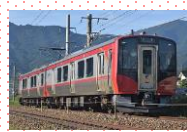
地域鉄道の車両更新補助