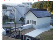
小水力発電所の設置