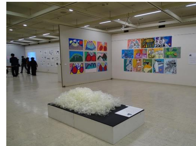
ザワメキアート展の様子