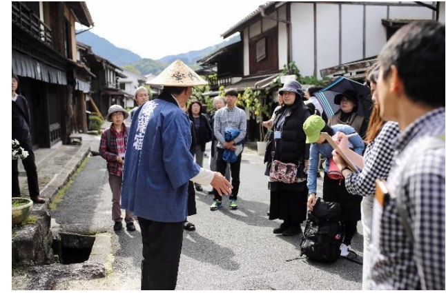
魅力体験ツアーの様子