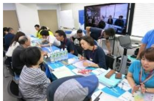
移住セミナーの様子