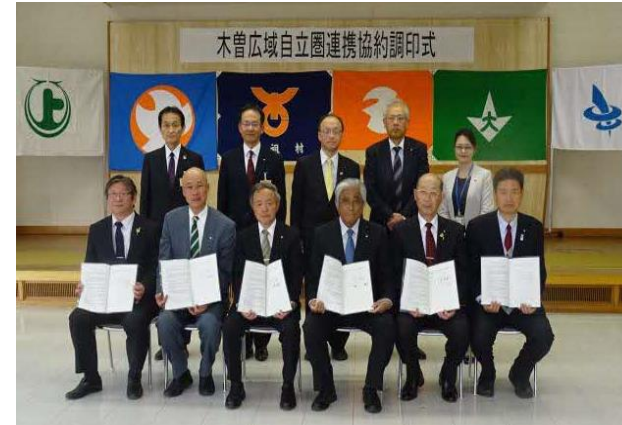
木曾広域自立圏連携協約合同調印式 (H30.3.29)