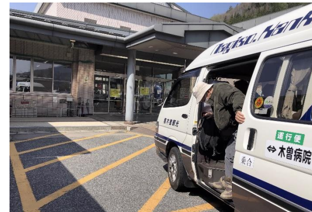
広域路線バスの共同運行