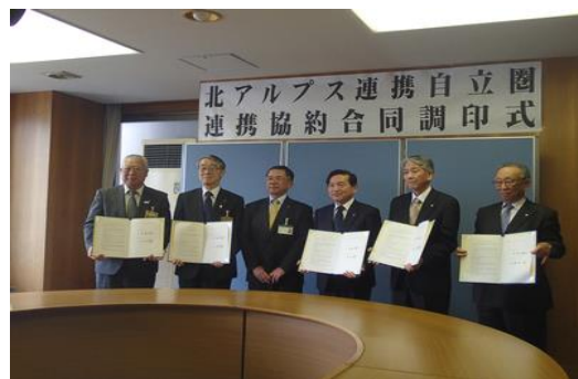
北アルプス連携自立圏連携協約合同調印式 (H28.3.29)