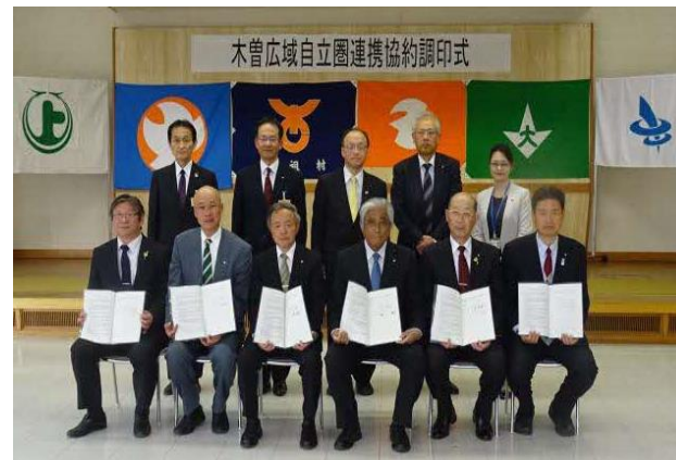
木曾広域自立圏連携協約合同調印式 (H30.3.29)