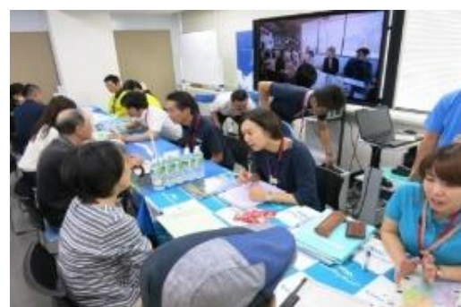
移住セミナーの様子