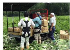
【アシストスーツの検討】