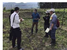
【研修生への個別支援】