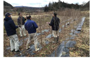
【啓翁桜の試験検討】