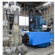
【上松町吉野発電所】