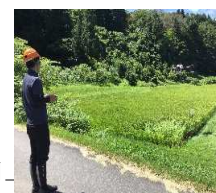
【農業用ドローンによる防除】