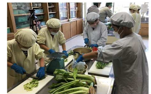
【小学生すんき体験】