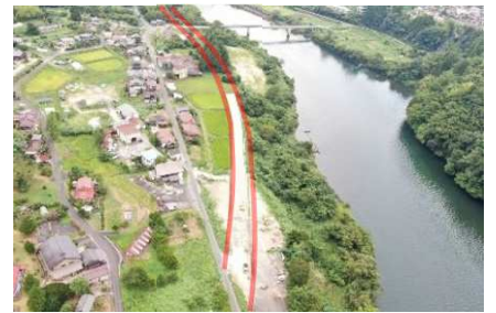
⑦殿～阿寺（大桑村） 新しい道路工事を実施中