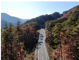
③登玉～和村地区 （上松町～大桑村） R2.12 供用開始