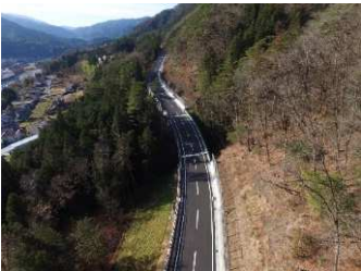
①川向地区（南木曾町） R2.12 供用開始