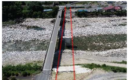
⑨和村橋（大桑村） 橋の架け替え工事を実施中