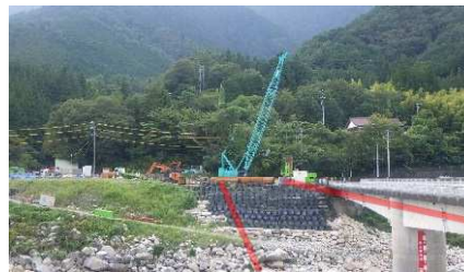
⑤高瀬橋（南木曾町） 橋の架け替え工事を実施中