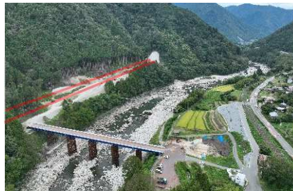
⑥読書ダム～戸場（大桑村～南木曾町） トンネル工事に伴う道路工事を実施中