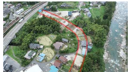
⑧大桑～殿（大桑村） 新しい橋と道路工事を実施中