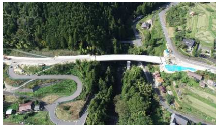
④田立大橋（南木曾町） 新しい橋と道路の工事を実施中