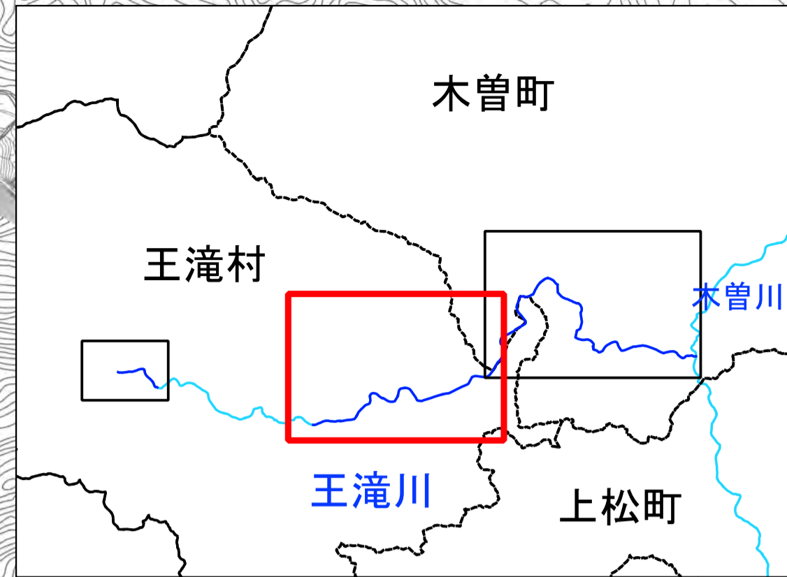
木曽川水系王滝川 洪水浸水想定区域図(想定最大規模降雨)