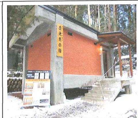
【国宝仁科神明宮】歴史展示館

令和元年に行った「仁科氏歴史・文化展」で展示した内容を地域伝統・文化を紹介すべく魅力ある情報として精査しパネル展示可能なコンテンツ作り及び展示会場造りを行った。