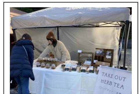
【マルシェ出店の様子】

○ECサイト活用による収益の安定化と多様な働き方の実現 ECサイトを導入し、商品の販売と植物療法士によるオンラインでのカウンセリングを実施した