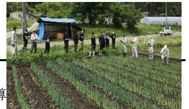
【白ネギモデルほ場巡回】