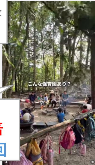
こんな保育園あり？