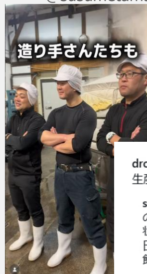
造り手さんたちも