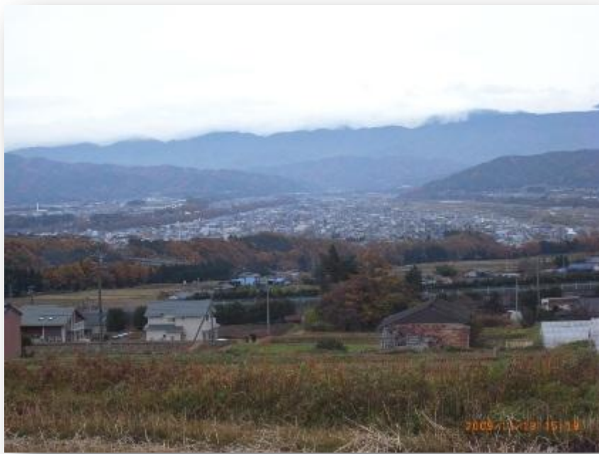
【写真 2】 山本団地からみた伊那谷の風景