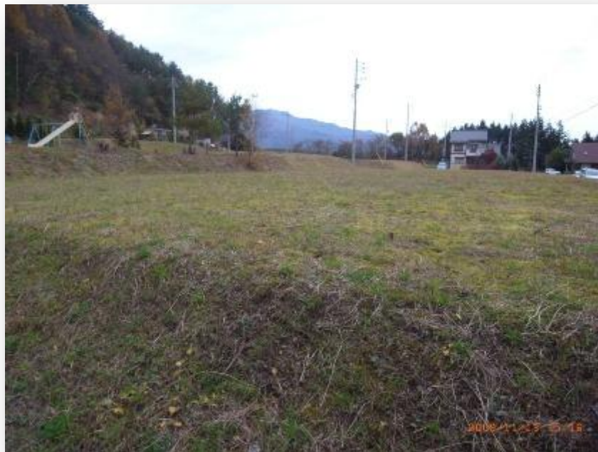
【写真 1】 山本団地（写真右手側が伊那谷）