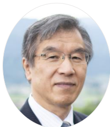
飯山市長 足立 正 則

第 42 回北信越国民体育大会が、北信越各地から多数の選手・監督並びに役員の皆様をお迎えして、飯山市において盛大に開催されますことは誠に喜ばしく、市民を代表して心から歓迎の意を表します。