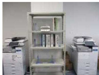
【写真 県記録本部の様子】