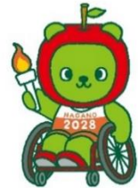
長野県キャラクター「アルケマ」