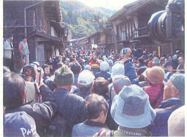
妻籠宿 (文化文政風俗絵巻之行列)