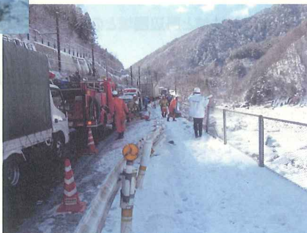
国道19号 平成23年1月27日 通行止め