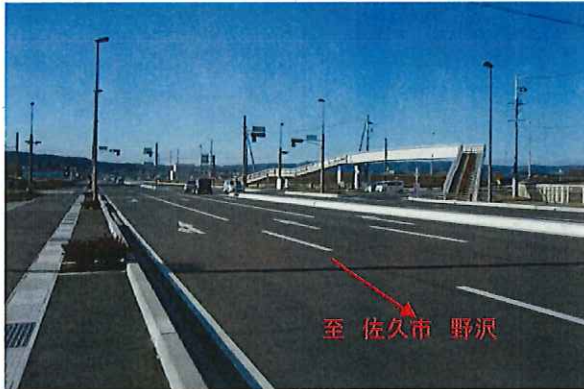
佐久南IC出口の4車線化整備済み区間

中部横断自動車道佐久南IC周辺整備として、国道142号の跡部～岸野間の4車線化を実施し、渋滞緩和を図ります。