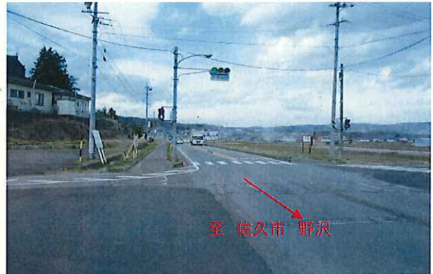
佐久南IC西側の4車線化計画箇所