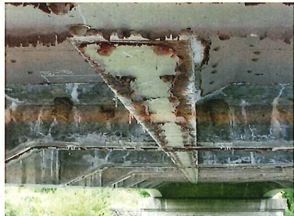
平成元年施工 鋼板接着の遊離石灰と錆