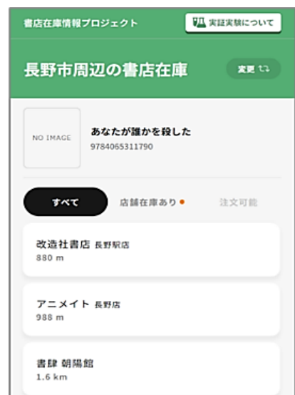
【書店在庫情報プロジェクト画面イメージ】

※実証実験がスタートしたばかりのため、現時点では在庫情報を見られる県内書店の数は少ないですが、長野県書店商業組合など関係団体との連携を進め、参画する書店を増やしていけるよう取り組んでいきます。