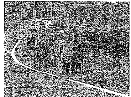
<集団下校する小学生>

年末を迎え、何かとお忙しい中ではありますが、都合のつく方はぜひご参加をお願いします。