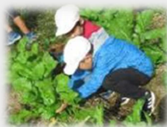
野沢菜収穫・漬物作り