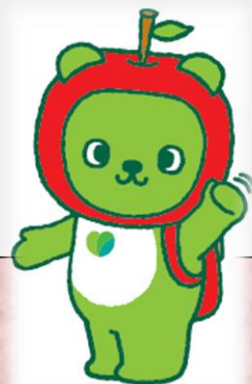
長野県PRキャラクター 「アルクマ」©長野県アルクマ