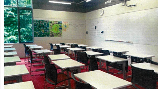
L字型にホワイトボードが設置され、奥行のある教室となっている。教室の外にはロッカーコーナーが設置されている。