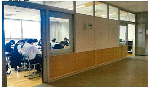
壁の一部をガラスとし、教室と廊下の繋がりをもたせている、壁はホワイトボード兼マグネットがつくもので掲示が容易。