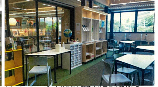
カウンターやテーブルなど多様な閲覧席や展示空間がある。