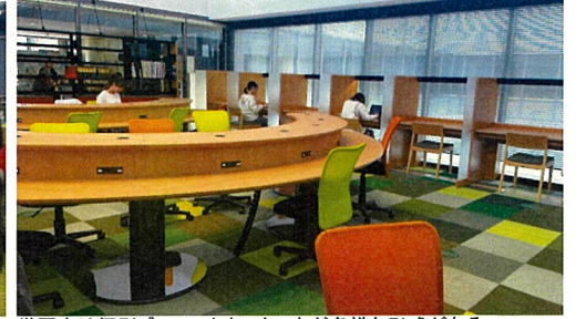
学習室は個別ブース、カウンターなど多様な形式がある。