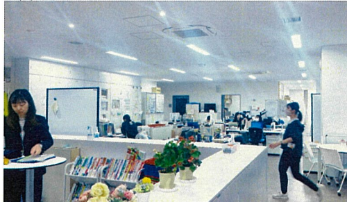
大職員室に、カウンターが設置されており、そこで質問対応可能。右写真は職員室奥に計画された、職員の休憩スペース。