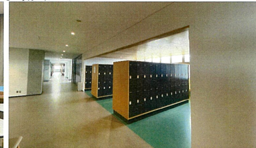
ロッカールーム、4教室のユニットにつき一カ所設置されている。