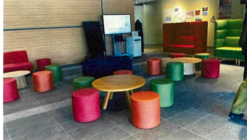
上下足の区別はない。エントランスには椅子やテーブルが配置。