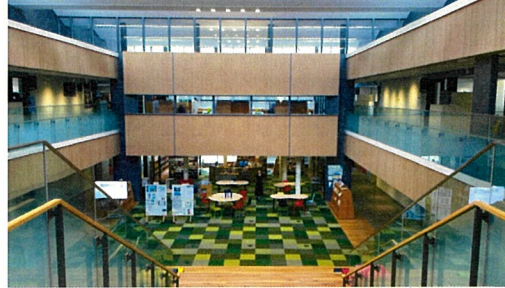
図書室と一体となった吹き抜け空間、空間の繋がりが生まれる。