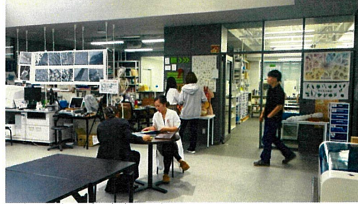
室の間には先生コーナーがあり、机や資料が置かれている。