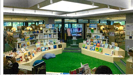
中央は絨毯になっており、くつろいで本を読むことや授業が可能。