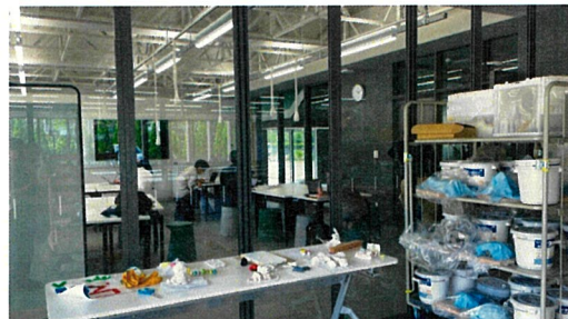
美術室の外では作品の展示や、絵画等が飾られている。