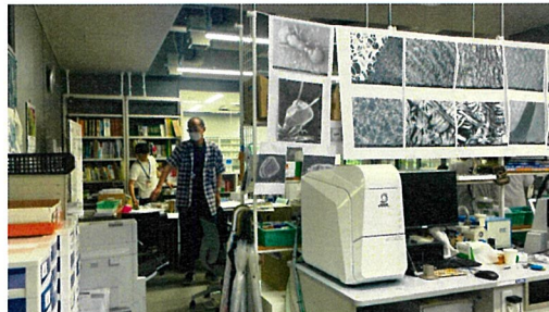
ラウンジにはゾーンごとの情報や展示、関連の書籍がある。