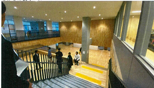
学校の中心に繋がる大階段、日常的にも生徒の集える場所となる。クッションも常備されている。