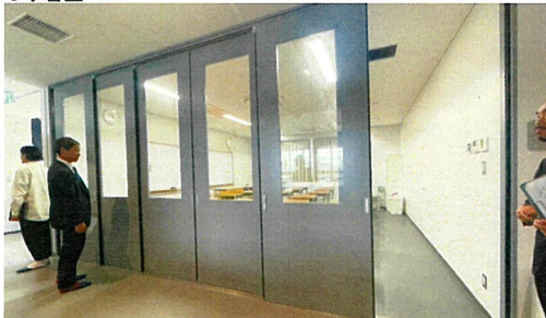
オープンなつくりで習熟度別授業など多様な活動に利用できる。