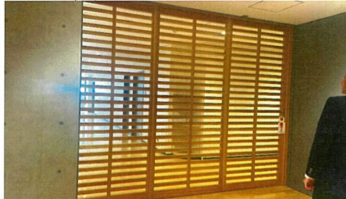
地域開放時のセキュリティ区画の木引き戸。