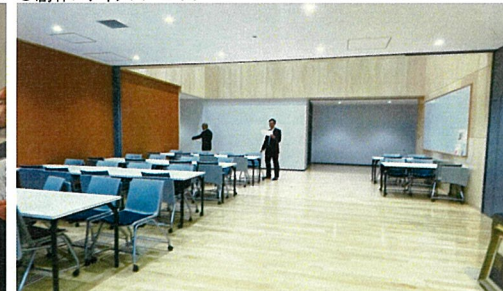
自由に使える机や椅子があり、展示することも可能な空間。