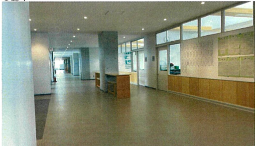
休み時間の生徒の居場所や教室との一体的な学習活動に利用可能。テーブルと椅子が常設されている。