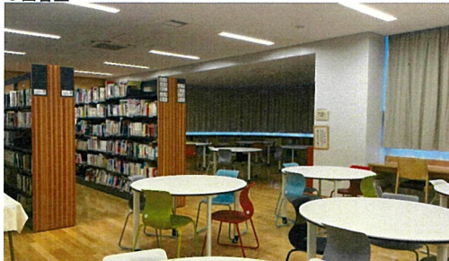
充実した閲覧スペースと書架があり、かしの樹ホールが望める。