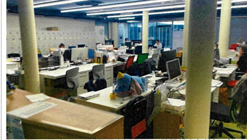
職員室内にカウンターが設置され、そこで質問対応なども可能。