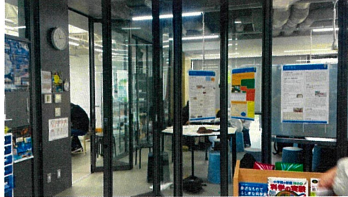
透明な折れ戸で仕切られた理科室では、生徒のポスターの展示や、先生の打合せが行われていた。