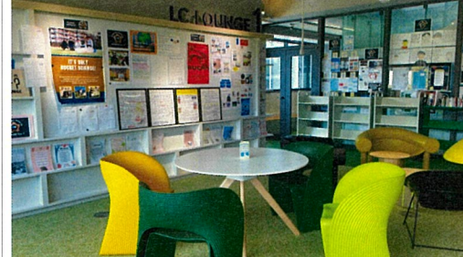
ハイカウンターや、テーブル、ボックス席など多様な居場所がある。