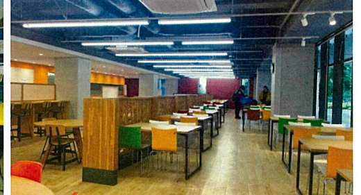
ハイカウンターや、テーブル、ボックス席など多様な居場所がある。