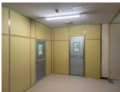
仮設間仕切壁施工状況