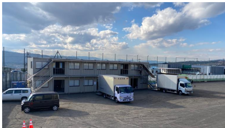
現場事務所設置状況