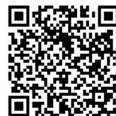
[動画 QR コード]

視聴した感想をまとめ、意見交換してみましょう。(2人で交代して行う方法もあります)