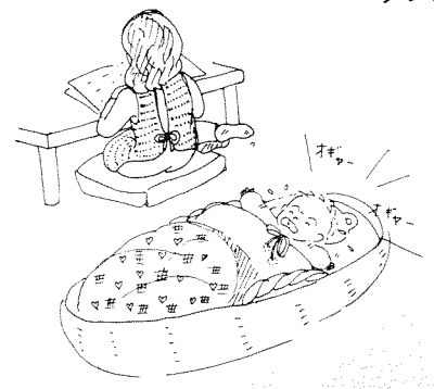
赤ちゃんの泣き声