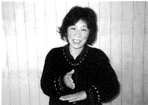
「ありがとう」 右手の小指側を左手の甲に軽くあて、 上げながら頭を下げる。