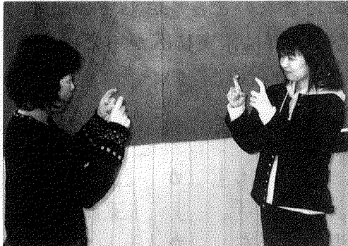
「こんにちは」 両手の人差し指を立て 曲げながら会釈する。