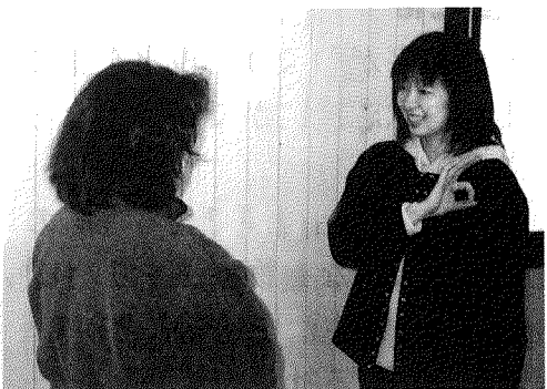
「名前」 右手の親指と人差し指で丸を作って、 左胸にあてる。