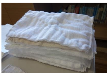
家庭科の学習で制作した浄巾