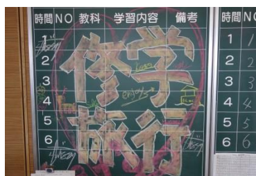
修学旅行への気持ちが高まる