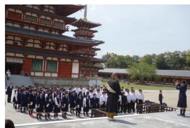
薬師寺で校歌と瓦と浄巾を奉納