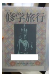
自分の切り絵が自分のしおりの表紙になる