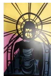
美術の時間に制作した仏像の切り絵