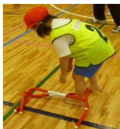
ミニハードルでは引っかかる