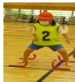
ミニハードルで再チャレンジ