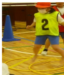
フラフープに戻り「リズムよく」を確認