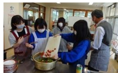
【「カレーの会」の様子】

体験活動のほとんどは、地域に住む方々で構成された子ども支援ボランティアグループの協力を得ながら行われている。地域の方々が支援者となり、「自分らしい学び」を積み重ねることで、登校することに抵抗感をもち、自信を無くしている子どもたちが自己肯定感を高め、自立するためのエネルギーを養う一助となっている。今後もさらに、安心して過ごすことのできる居場所づくりを進めていく。