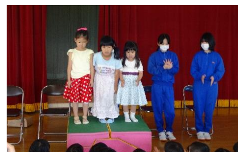
【中学生が製作したスカートを試着する保育園児】