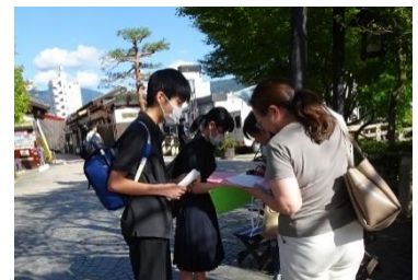
【中学生の活動の様子】