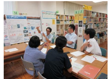
【3校の職員合同の研修会】

これらの研修の成果を生かし、丸ノ内中学校では、自校の総合的な学習の時間の在り方と教師の関わり方について検討を重ね、2学期には、実際に生徒一人一人がテーマを決め、市内で探究的な活動を行う「1日忠恕の日」を行うなど、生徒自らが考え、行動する「探究的な学習」がスタートしている。