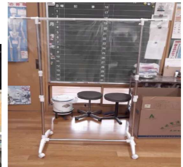
キャスター付きラックに ビニールシートをつける