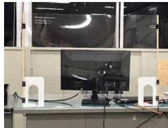
アクリル板をブック エンドに取付