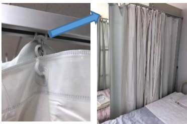
シャワーカーテンと カーテンを2重に取 付け、使い分ける