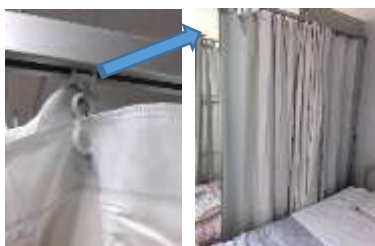
シャワーカーテンとカーテンを2重に取付け、使い分ける