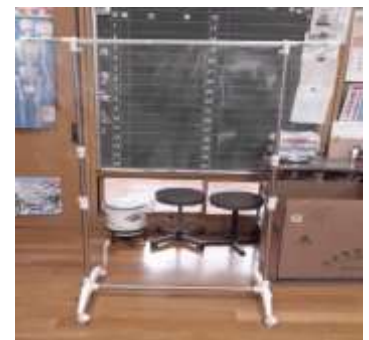
キャスター付きラックにビニールシートをつける