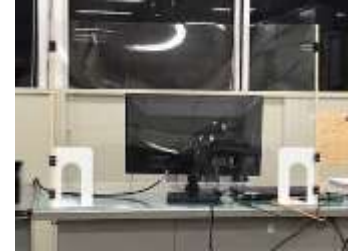
アクリル板をブック エンドに取付